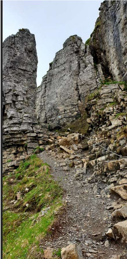
Abstieg vom Ifen