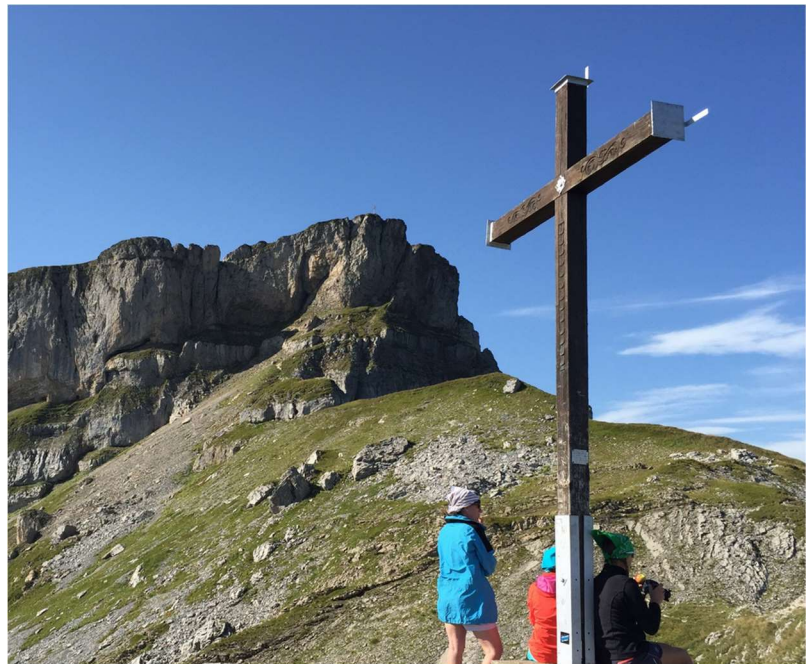
Hahnenköpfe im Hintergrund Ifen